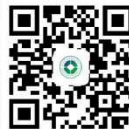
四川省中医药发展服务中心 官方网站