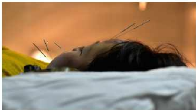
达州市卫计局 向阳：灸疗