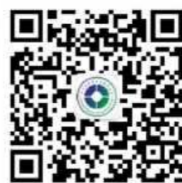
四川省中医药发展服务中心 官方微信

四川省中医药发展服务中心将始终围绕四川中医药强省战略,牢牢把握当前中医药“天时、地利、人和”的发展良机,在省中医药管理局的领导下,积极整合行业及社会资源,以规范创新的管理体制和高效和谐的运行机制,促进并建立与省内外相关机构之间的合作关系,努力为全省中医医疗机构、中医药科研单位及中医药企业搭建沟通交流平台及商务拓展平台,助推四川中医药振兴发展。