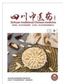
本期封面 (稿件截至11月15日)