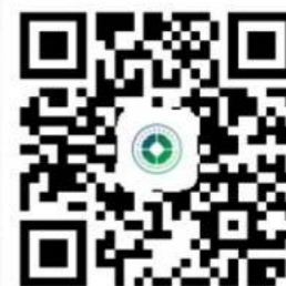
四川省中医药发展服务中心 官方网站