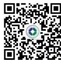
四川省中医药发展服务中心 官方微信

四川省中医药发展服务中心将始终围绕四川中医药强省战略，牢牢把握当前中医药“天时、地利、人和”的发展良机，在省中医药管理局的领导下，积极整合行业及社会资源，以规范创新的管理体制和高效和谐的运行机制，促进并建立与省内外相关机构之间的合作关系，努力为全省中医医疗机构、中医药科研单位及中医药企业搭建沟通交流平台及商务拓展平台，助推四川中医药振兴发展。