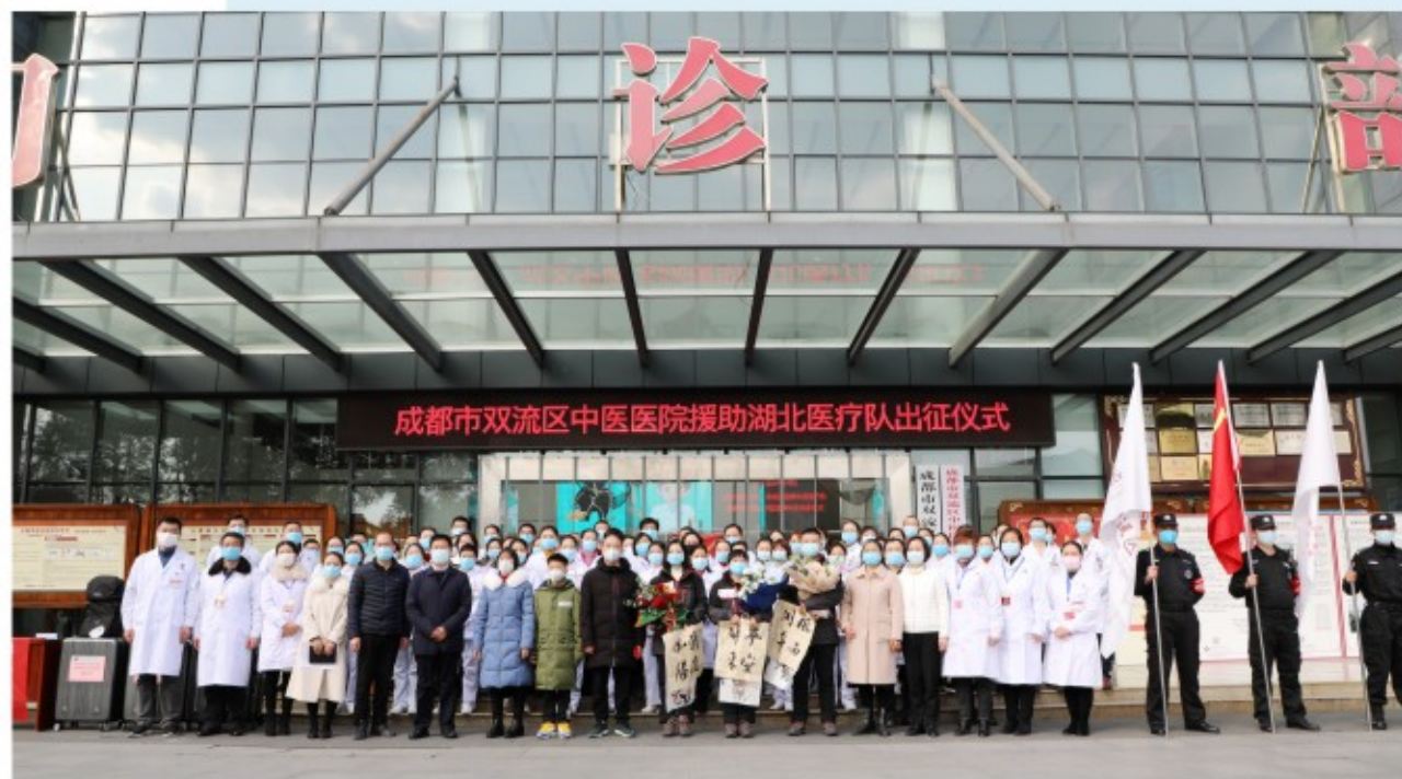
成都市双流区中医医院援鄂医疗队出征

精准帮扶促发展。另一方面，为将“传帮带”工作进一步深入，促进基层医院诊疗水平的提升，更好地运用中医适宜技术为基层群众服务。医院先后与区外巴塘县中藏医院、巴塘县人民医院、青川县