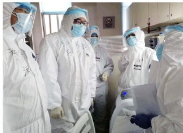
四川省中医医院医生在武汉红十字会医院会诊