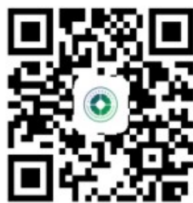
四川省中医药发展服务中心 官方网站