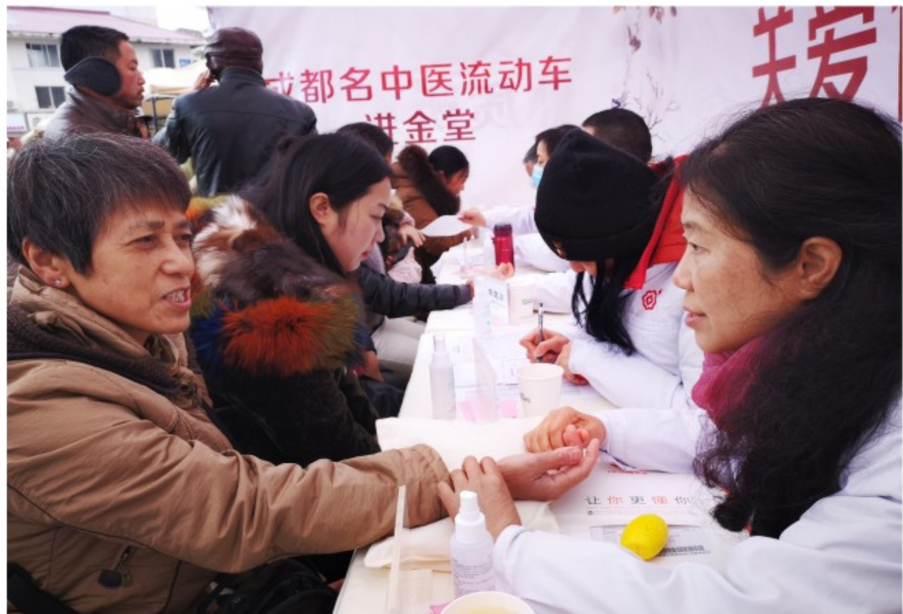
名中医流动车进基层