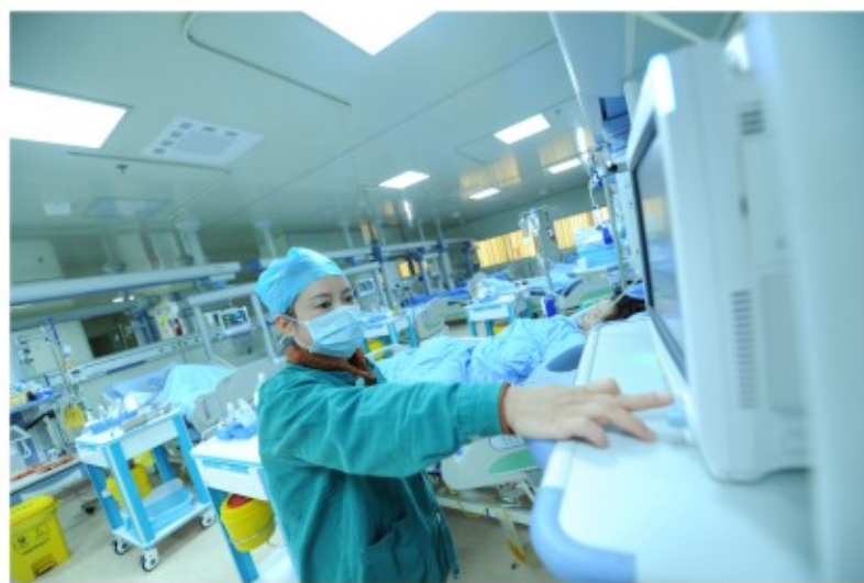
成都市双流区中医医院现代标准化建设ICU