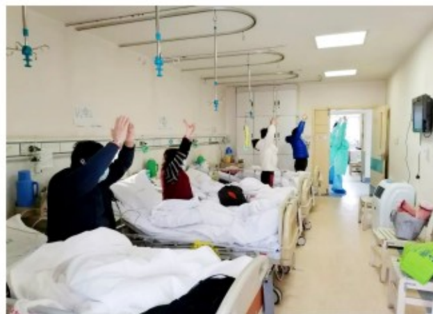
四川省中医医院护理人员教授武汉患者中医传统功法五禽戏

近年来，医院通过强化中医药传承教育。鼓励名老中医药专家通过师带徒、继教、教学、培训、教材专著等多种方式，