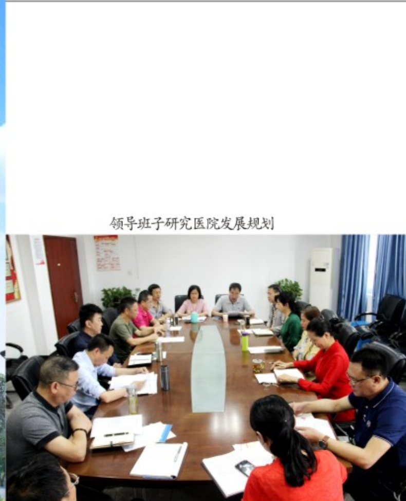
领导班子研究医院发展规划