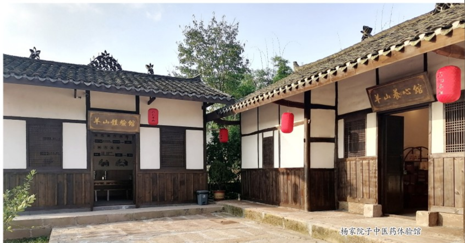
杨家院子中医药体验馆