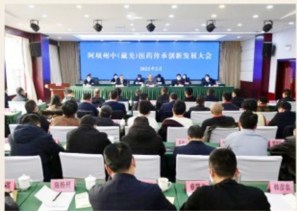
在阿坝州中（藏羌）医药传承创新发

1月27日，省委省政府高规格召开全省中医药传承创新发展大会，省委书记彭清华出席会议并讲话，对四川中医药传承创新发展工作作出安排部署。2021年省“两会”期间，时任代省长黄强作政府工作报告，强调重视中医药全产业链发展。会后，各地党委政府立即行动，及时召开中医药传承创新发展相关会议，用实际行动贯彻落实大会精神，吹响中医药传承创新发展号角。