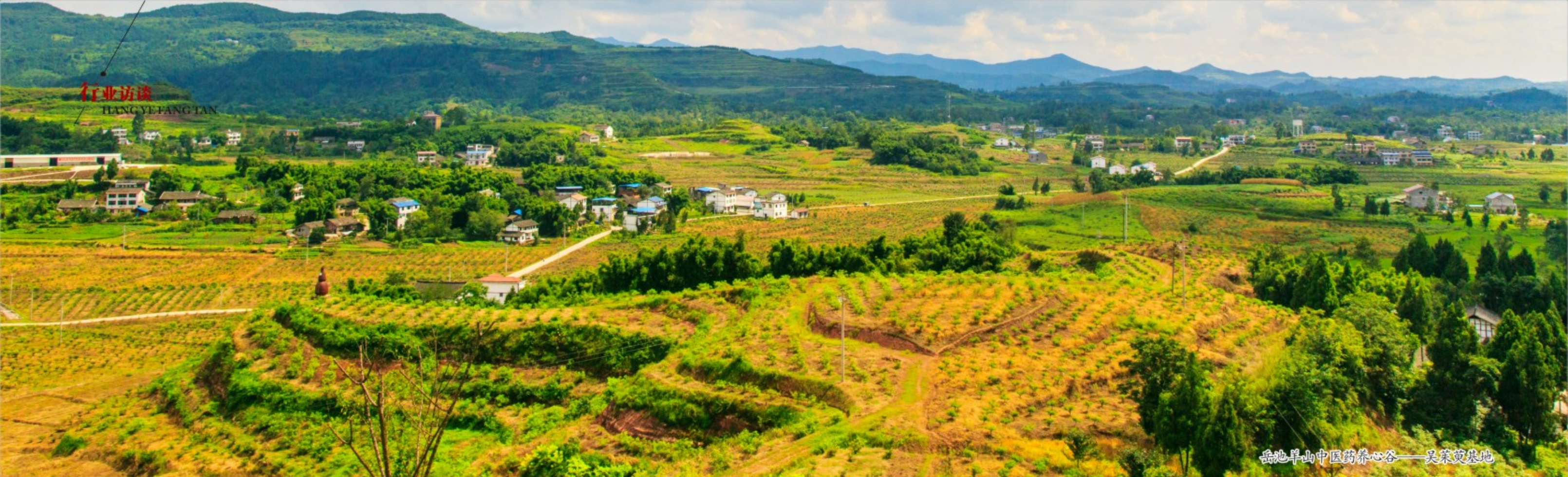
岳池羊山中医药养心谷——吴茱萸基地