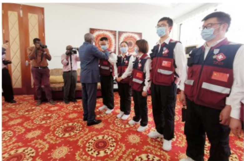
2020年5月，吉布提总理卡米勒为中国赴吉布提医疗专家组授勋，四川省中医医院医生获“骑士级独立日勋章”

长期以来，相较于综合医院，中医医院相对来说底子较薄，随着公立医院改革的全面推进，在取消药品收入和耗材收入