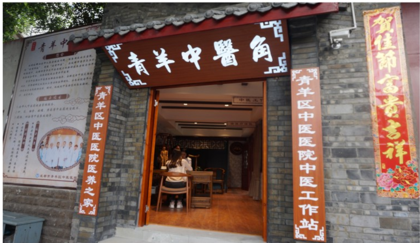
成都市创新提出“中医角”概念，在村卫生室、社区工作站、社区养老服务中心、地铁商圈、创业园区等老百姓的家门口建成“中医角”3200多个，极大的提高了老百姓中医药服务的获得感和可及性

推进中医药健康服务业发展，推进都江堰市“国家中医药健康旅游示范区”建设，鼓励各区（市）县争创“四川省中医药健康旅游示范基地、项目”。高质量规