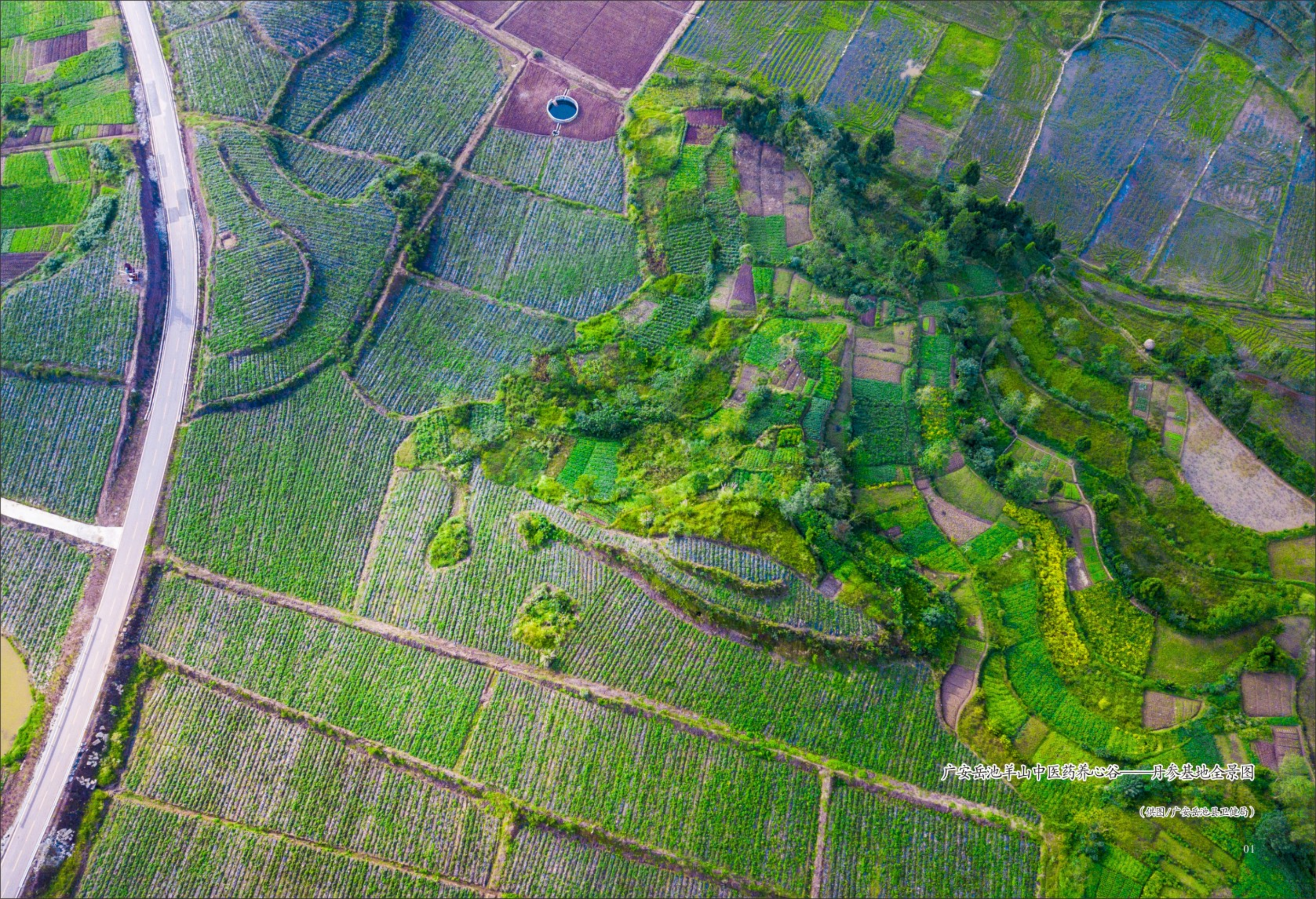
广安岳池羊山中医药养心谷——丹参基地全景图