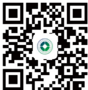
四川省中医药发展服务中心 官方网站

本刊属行业内刊, 不对外发行, 不以盈利为目的, 仅对中医药行业内的政策法规及大事记进行宣传, 引用稿件一律注明来源, 如涉及版权问题, 请及时与我们联系。