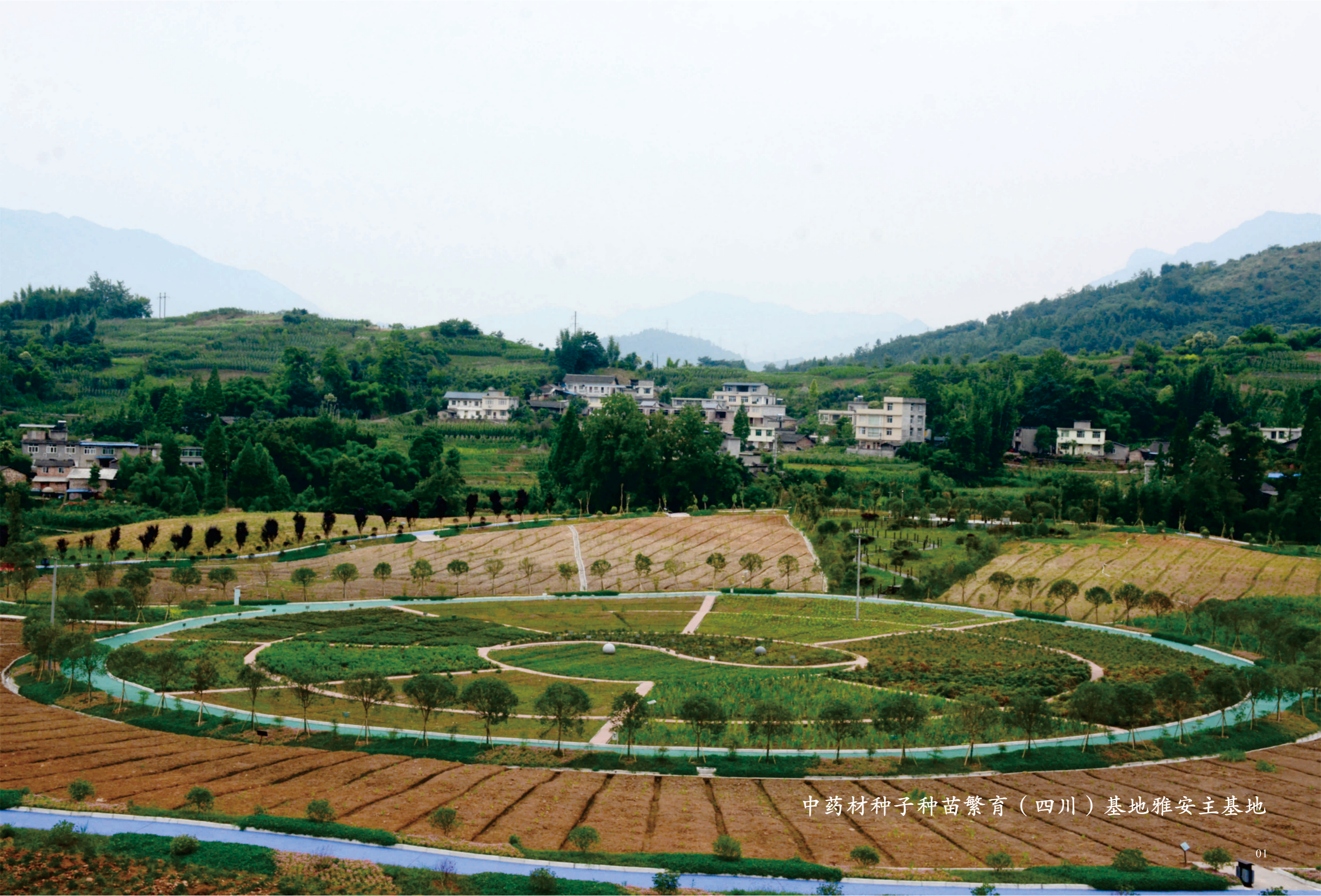
中药材种子种苗繁育（四川）基地雅安主基地