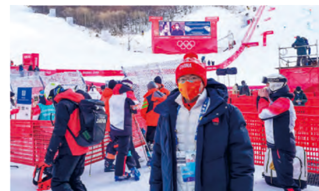
四川滑雪中医: “所有汗水和付出都是为了这一天, 值了!” P77