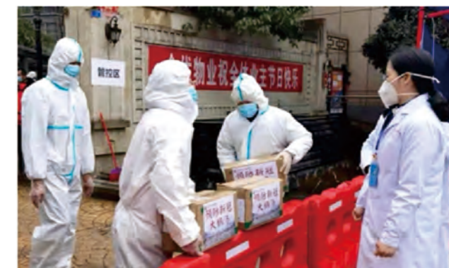
四川: 中医药第一时间介入新冠肺炎患者治疗 P54