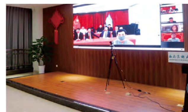
天府云医·海外惠侨远程医疗站: 让优质的中医药服务惠及更多的海外侨胞 P31