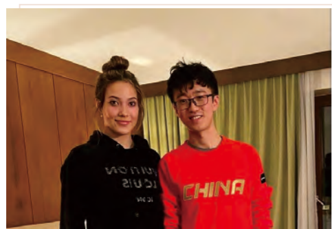
朱江伟与谷爱凌合影