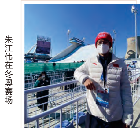
朱江伟在冬奥赛场