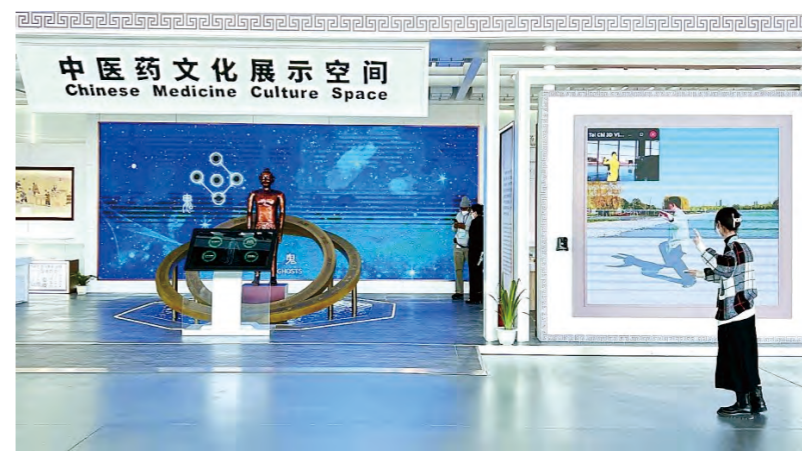
1枚诺贝尔奖书写中医药对人类的贡献 作为此次展览的第一部分，用全世界影响最

经北京2022年冬奥会和冬残奥会组织委员会同意，在国家中医药管理局的指导下，由中国中医科学院牵头在冬奥会主媒体中心设中医药文化展示空间。这是中医药作为特展首次在奥运会上亮相，是向全世界展示中医药文化的难得机遇。中医药文化展示空间设在冬奥会主媒体中心。主媒体中心是全球注册平面媒体及转播商的赛时媒体总部，预计接待3000多名文字及摄影记者，约12000名转播人员，包括来自全世界的主要国际媒体记者。中医药文化展示空间展览以中医药参与疫情防控为基线，围绕“一枚诺贝尔奖、两部世界记忆名录、三个世界非物质文化遗产、四次中药资源普查、五大体验项目”展开。