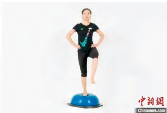
四川省骨科医院医生展示波速球上单脚站立