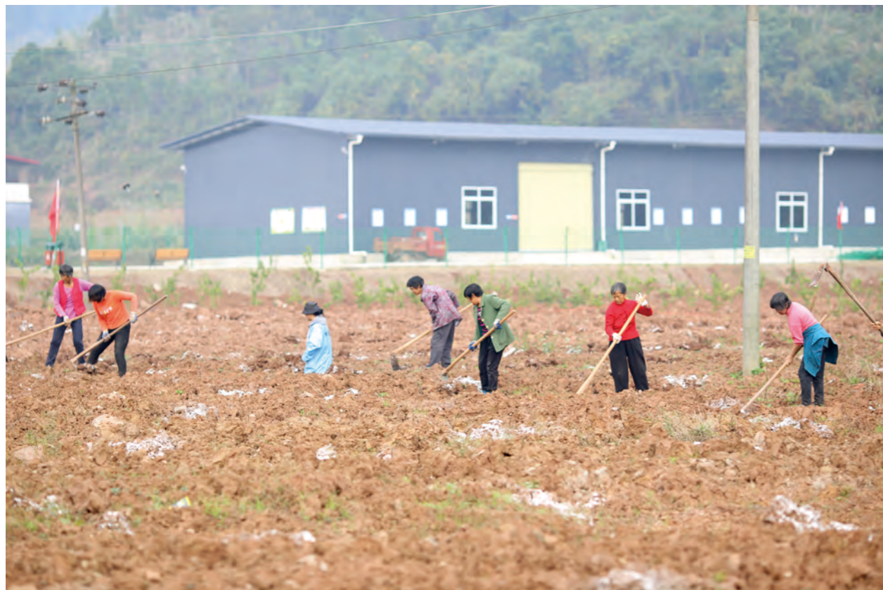
大英县现代农业园区种植中药材