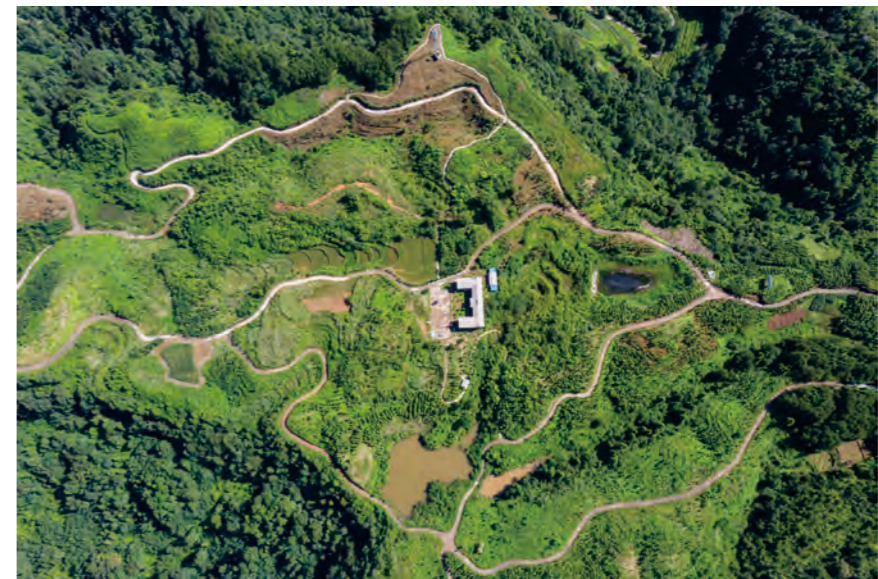
观山中药材种植基地

达州是中医药大市，资源丰富、基础厚实。近年来，达州市坚持遵循中医药发展规律，创新中医药管理体制，加快中医药供给侧结构性改革，积极推进中医药融入经济社会发展大局和健康达州，紧扣建设秦巴地区中医药大健康产业发展高地，积极开展全省中医药综合改革先行示范创建。