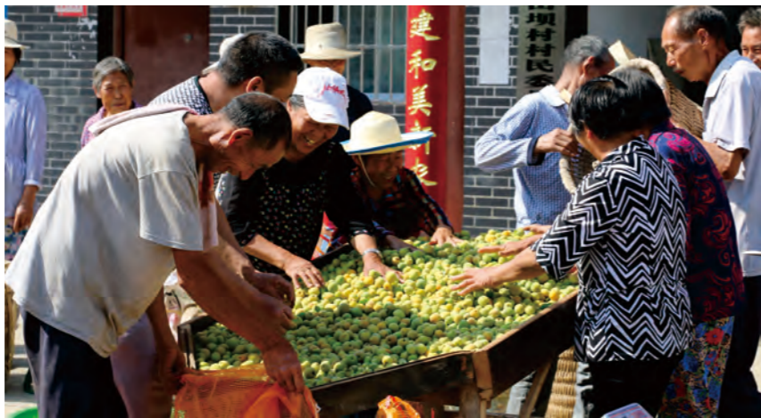
达川乌梅喜获丰收

可以看到的是，未来几年达州将书写做好做强中医药持续发展的答卷，全力推动达州中医药全面融入成渝地区双城经济圈建设，惠及达州人民对中医药的健康服务需求，助力达州经济社会的高质量发展。